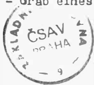
Tab. 42 1 - Mikulčice (o.Hodonín). Tausovaná značka na meči z hrobky velmože od trojlodního kostela. - Tauschiertes Zeichen auf einem Schwert aus einer Fürstengruft bei der dreischiffigen Kirche; 2 - Blučina (o.Brno-venkov). Hrob slovanského bojovníka. - Grab eines slawischen Kriegers.