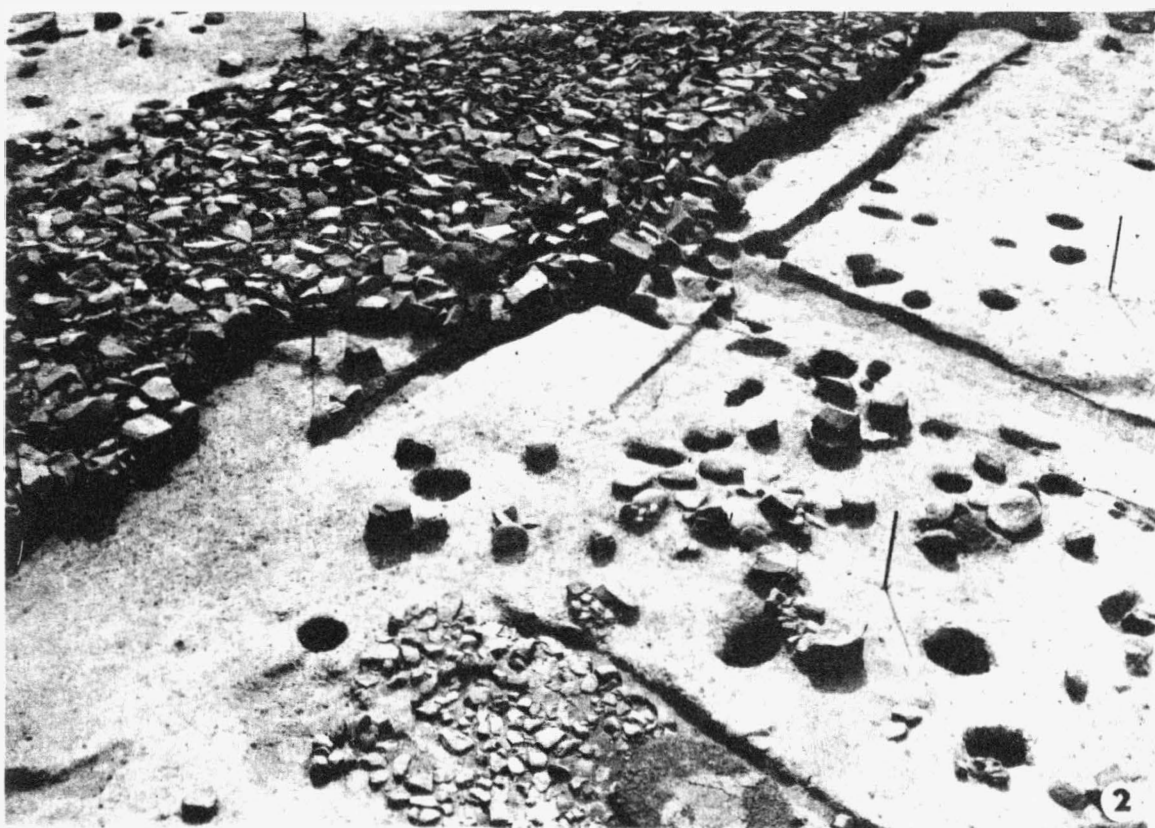
Tab. 34 Malé Hradisko (o. Prostějov). Keltské oppidum Staré Hradisko: 1 - Dlážděná cesta; 2 - Dlážděná cesta s částí "dvorce". - 1 - Gepflasteter Weg; 2 - Gepflasteter Weg und Teil eines "Gehöftes".