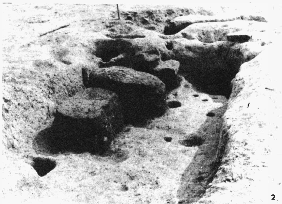
Tab. 35 Malé Hradisko (o.Prostějov). Keltické oppidum Staré Hradisko: 1 - Zahloubená chata s žernovem; 2 - Zahloubená chata se dvěma ohništi. 1 - Eingetieftete Hütte mit Mahlstein; 2 - Eingetieftete Hütte mit zwei Feuerstellen.