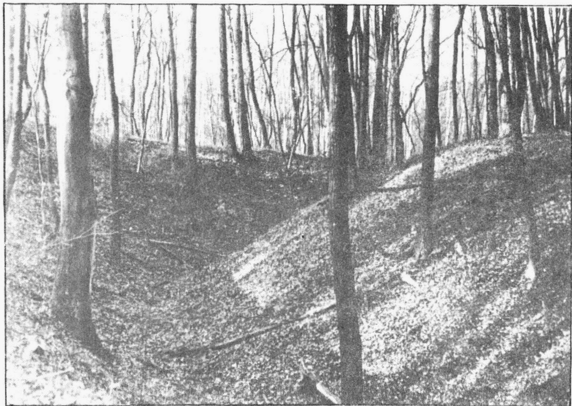
Tab. 8 Nížkovice - Heršpice /okr. Vyškov/. Hrádek "Kepkov" . Pohled na opevnění. - Hausberg "Kepkov". Ansicht auf die Befestigung.