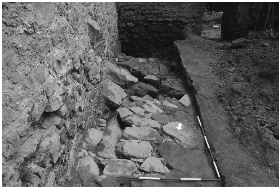
Obr. 65. Lukov, Horní hrad. Pohled na novověkou dlažbu zachycenou při výzkumu.

Sonda o rozměrech 5,5×1,5 m byla položena v jihovýchodním rohu paláce podél jeho východní stěny. V téměř celé své délce byla těsně pod povrchem odkryta novověká kamenná dlažba (obr. 65), která však byla v jihovýchodním rohu místnosti narušena mladším výkopem. V tomto místě bylo proto možné bez zničení dlažby vykopat sondu do hloubky více než 2,5 m. Následně však musely být práce zastaveny kvůli nebezpečí sesuvu nesourodých profilů a kamenných stěn. Ani v této hloubce se nepodařilo dosáhnout vrstev starších než cca 16. – 17. století. Zajímavé poznatky přinesl průzkum sondou obnažených stěn paláce. Jižní dodnes dochovanou nepřestavěnou zeď se podařilo již v dřívějších letech zařadit do pozdně románského období, ostatní stěny paláce vystupující na povrch však odpovídají až o poznání mladšímu datování. Nyní byly však téměř u dna sondy nalezeny zbytky původní východní stěny, tvořící s jižní stěnou nároží, a podařilo se tak prokázat, že stěny východního paláce stojí alespoň