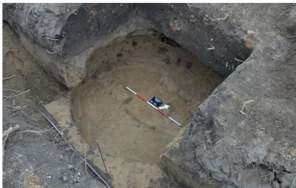
Obr. 10. Odrovice. Zásobní jáma z mladší doby bronzové.

Odrovice (Bez. Brno-venkov), Gemeinde. Jüngere Bronzezeit. Siedlung. Rettungsgrabung.