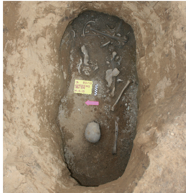
Obr. 11. Olomouc, ulice Janského. Lidské kosti na dně jámy 574.

Abb. 11. Olomouc, Janského Straße. Die Menschenknochen in der Grube 574.