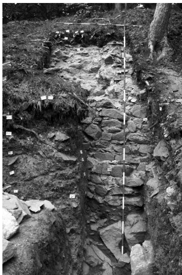
Obr. 47. Ludvíkov, zřícenina hradu Fürstenwalde. Sonda S6 – hradba.

Zkoumané místo se nalézalo na vrcholu skalního výchozu při jižním okraji temene hory. Na ploše cca 55 m 2