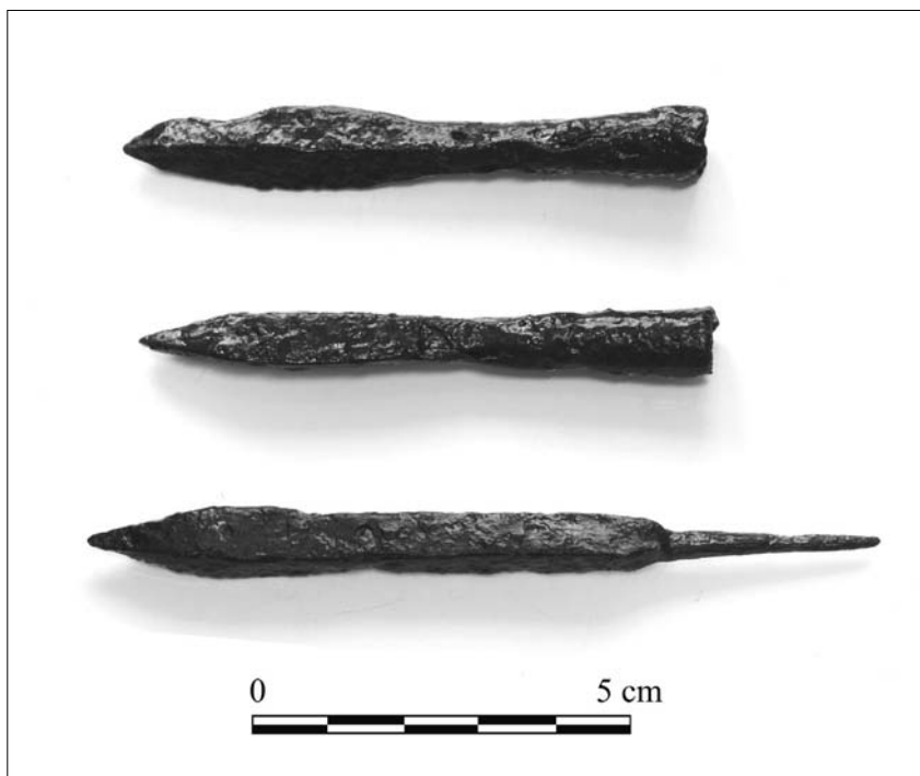
Obr. 48. Ludvíkov, zřícenina hradu Fürstenwalde. Hroty šípů do kuše.

Abb. 48. Ludvíkov, die Burgruine Fürstenwalde. Pfeilspitzen in Armbrust.