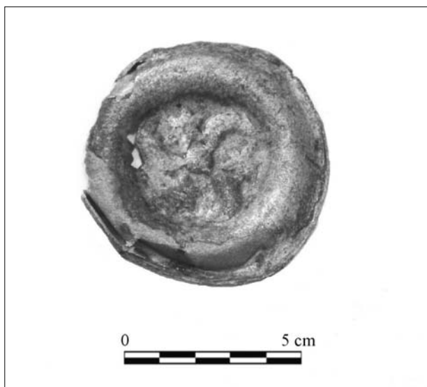
Obr. 49. Ludvíkov, zřícenina hradu Fürstenwalde. Brakeátový halěř.

Archeologickým výzkumem byl odkryt líc a část dochovaného povrchu obvodové hradby (obr. 47). Lícované zdivo složené z kamenných prvků značně rozličných velikostí bylo pojeno vápennou maltou. Řádkovací technika uplatněná ve spodních partiích zdi byla nekvalitní, spíše jen v náznacích, a směrem nahoru přecházela v techniku vrstvení. Bylo též zachyceno zalomení průběhu hradby, které kopírovalo povrch terénu. Průzkum uloženin za-