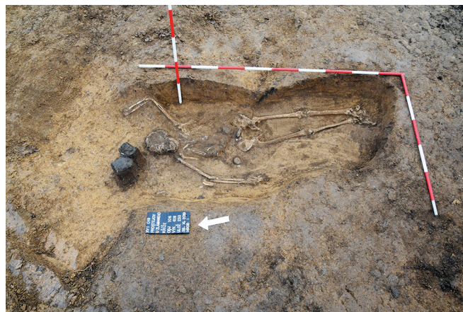
Obr. 5. Prostějov – „U zlámaného kříže“. Pohřeb dospělého jedince s milodary v podobě kančích klů. Foto L. Šín.

Výzkum probíhal na dvou nestejně velkých plochách vzdálených od sebe asi 250 m. Větší plocha se nacházela právě v trati „Za Kovárnou“ na samém severním okraji Prostějova, při silnici a železniční trati vedoucí do Kostelce na Hané. Druhá plocha se nacházela SV od první při silnici na Smržice a prokázala pokračování osídlení tímto směrem, které se již nacházelo v trati „U zlámaného kříže“.