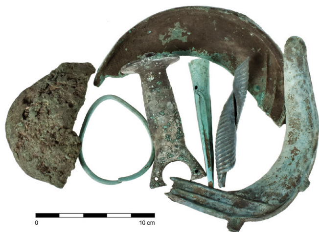
Obr. 14. Šebetov. Výběr předmětů z depotu Šebetov 4.