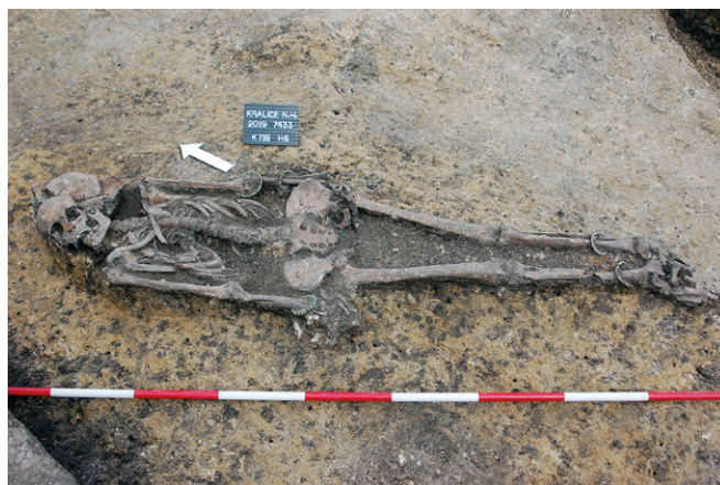
Obr. 10. Kralice na Hané, okr. Prostějov. Kostrový hrob č. 6/2019 z období LT B2.