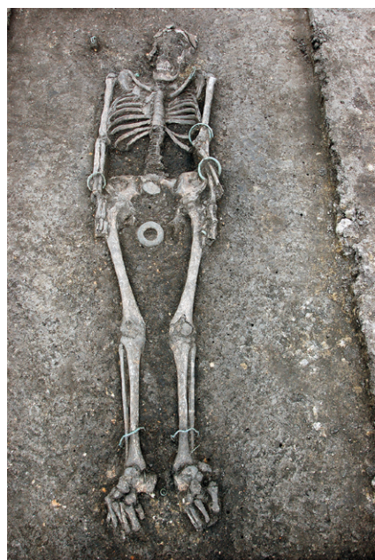
Obr. 9 Kralice na Hané, okr. Prostějov. Kostrový hrob č. 1/2019 z období LT B1.

Zajímavým objevem je zde skupina 10 keltských kostrových hrobů náležejících k menšímu plochému pohřebišti (cf. Čižmářová 2017, 174–175, tab. 61: 5–17, tab. 90–91; Fojtík 2006; Fojtík 2008) datovanému do starší doby laténské (LT B1–B2, tj. 4. stol. před Kristem). Dva pohřby (H1/2019 – obr. 9 a H6/2019 – obr. 10), v obou případech náležející jedincům ženského pohlaví (dívce na prahu dospělosti a dospělé ženě), poskytly exkluzivní výstavu