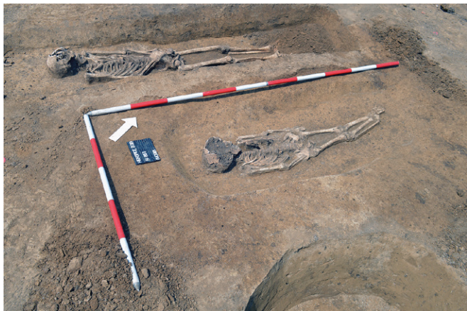
Obr. 4. Horní Heršpice. Hroby H 851 a H 852 (11. století). Fig. 4. Horní Heršpice. Graves H 851 a H 852 (11 th century).

Podařilo se zachytit okraj raně středověkého pohřebiště, na kterém bylo celkem zjištěno 55 hrobů. Vzhledem k ukončení výstavby v tomto prostoru jde pravděpodobně o počet konečný. Nezastavěné pozemky se nacházejí již jen východním směrem, zde ovšem pohřebiště nepokračuje.