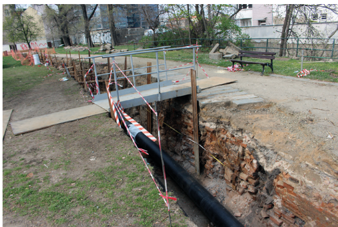
Obr. 21. Brno, Čechyňská, Dornych, Zvonařka. Pohled na plochu výzkumu od jihu.

Relikty barvírny byly zachyceny v úseku teplovodu, který byl proveden v zeleném pásu mezi ulicemi Dornych a trasou Ponávky (Svrateckého náhonu; obr. 21). V západní části výkopu se nacházela patrně první budova a ve východní části budova druhá, tak jak je situace vyobrazena na indikační skice z roku 1876. Obě části byly zřejmě po zbourání barvírny na počátku 20. století zasypány, dochovalo se tedy jen podzemní technologické zařízení a zřejmě i část přízemí, kde byly umístěny bloky pro usazení barvířských kotlů (podrobněji Antal, Zbranek 2019).