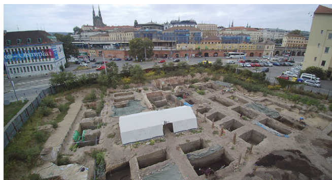
Obr. 23. Brno, ulice Dornych, Mlýnská, Spálená. Pohled na zkoumanou plochu od východu.