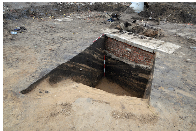
Obr. 38. Brno-Zábrdovice. Pohled na řez zasypanou úvozovou cestou. Zpracování I. Čižmář.

Profil úvozové cesty byl z východní strany narušen mladším zásahem souvisejícím s těžbou zeminy pro stavbu náspu přilehlé železnice.