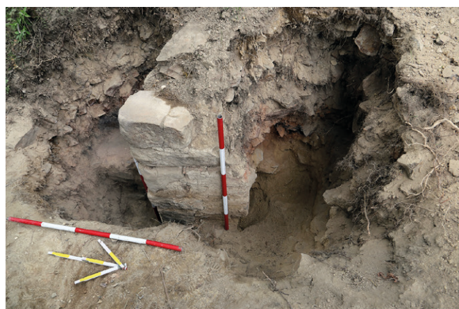
Obr. 48 Jamolice, Hrad Templštejn. Sonda S1/C, brána, pohled z východu. Vnitřní strana brány s patrnou špaletou a zbytky omítky. Ve směru šipky se nachází jádro hradu, na opačné straně pak minulý rok odkrytá vlní jáma (Dejmal 2019, 267–268).

Další zkoumanou plochou byl prostor severovýchodního nároží jádra, zde bylo navázáno na práce z roku 2018. Důvodem výzkumu jsou velké statické poruchy zdiva jádra v těchto místech. Výzkumem bylo částečně odhaleno nároží budovy, která byla do severovýchodního rohu hradního jádra vložena. Patrně se tak stalo dodatečně, jelikož jak západní, tak jižní obvodová zeď budovy jsou k hlavní hradbě přizděny na spáru. Odkryta byla část přízemí budovy, v předchozích letech pak byly vykopány a dokumentovány situace v úrovni prvního patra. Výzkum tohoto nároží bude pokračovat i v dalších letech, jelikož se ukázalo, že východní hradba jádra je v tomto prostoru pod úrovní terénu značně poškozena a vyžaduje další statické zajištění.