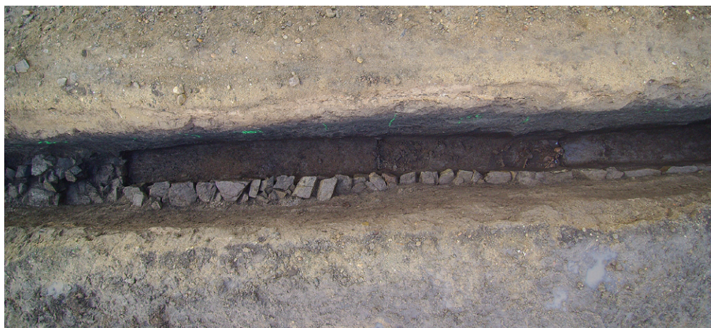
Obr. 45. Ivančice, Palackého náměstí. Konstrukce s. j. 920, která byla postavená ve 12. či na počátku 13. století.