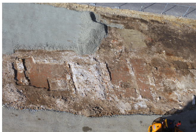
Obr. 46. Ivančice, Palackého náměstí. Raně novověká budova související buď s kostelem, nebo s tržištěm, která je patrná ještě na plánu města Ivančic z poloviny 18. století.

Mimo samotný pohřební areál byl zdokumentován i prostor severně od hřbitovní zdi. Stavební práce se v tomto prostoru omezily na výměnu dlažby a přespádování povrchu. Pouze v místech, kde měla být osazena konstrukce pro ukotvení vánočního stromu, byla vyhloubena sonda o rozměrech 2 × 2 m a hloubce 2,3 m. Na profilech této sondy byl dokumentován nárůst terénu ve 14. a 15. století. Geologické podloží se nalézalo pod niveletou dna stavební jámy. Ve zbylém odkrytém prostoru byla zachycena rozsáhlá budova, která měla minimálně tři stavební fáze. V místě styku s ohradní zdí hřbitova byla však porušena inženýrskou sítí, pravděpodobně výkopem pro kanalizaci z 19. století, nešlo proto zjistit vztah mezi odkrytými konstrukcemi a ohradní zdí hřbitova z 15. století. Nejmladší fáze budovy měřila přes 25 m a byla rozčleněna na 6 místností (obr. 46). Budova souvisela buď s kostelem, nebo s přilehlým tržištěm. Je vyobrazena ještě na plánu města z poloviny 18. století.