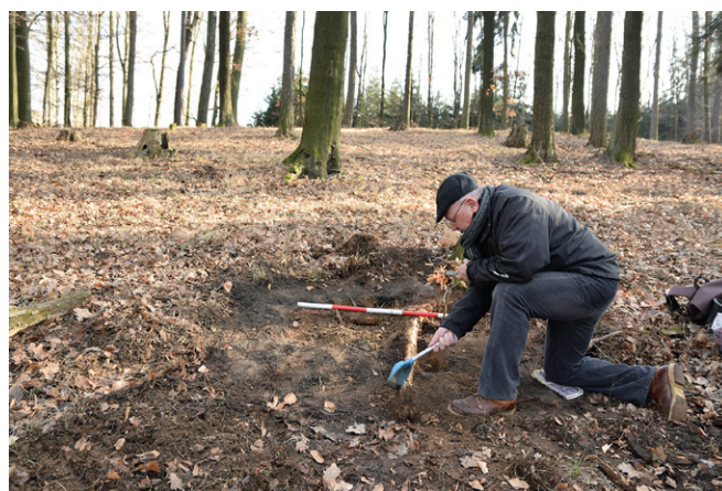
Obr. 49 Jankovice 2019. Místo nálezů kovových artefaktů.