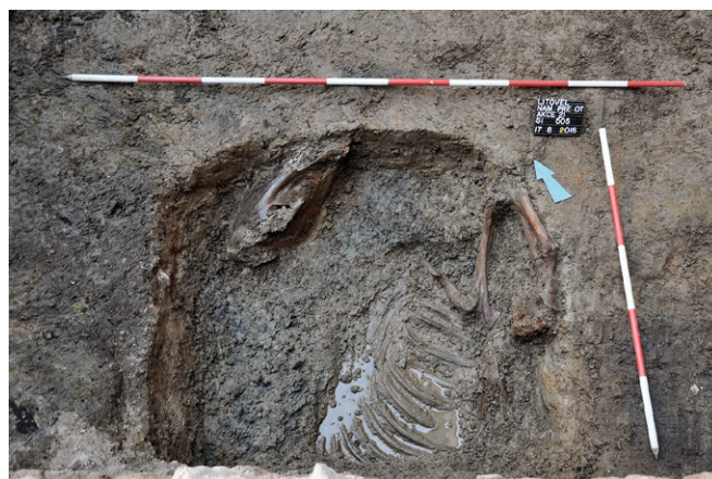
Obr. 65. Litovel, náměstí Přemysla Otakara č. p. 777, pohřeb koně.

Zbylé kulturní vrstvy, a to zejména ty silně organogenní ze 13. století, velmi dobře zachovaly hned sedm úrovní různých dřevěných konstrukcí. Jak z nich, tak i z okolních uloženin byly průběžně odebrány vzorky na příslušné analýzy. U všech těchto konstrukcí se s největší pravděpodobností jednalo o pozůstatky