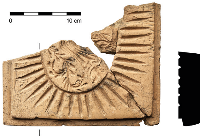
Obr. 68. Loštice. Fragment lící formy. Kresba L. Hlubek.