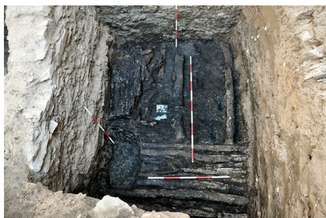
Obr. 66. Litovel, náměstí Přemysla Otakara č. p. 777, jedna z vypreparovaných dřevěných konstrukcí.