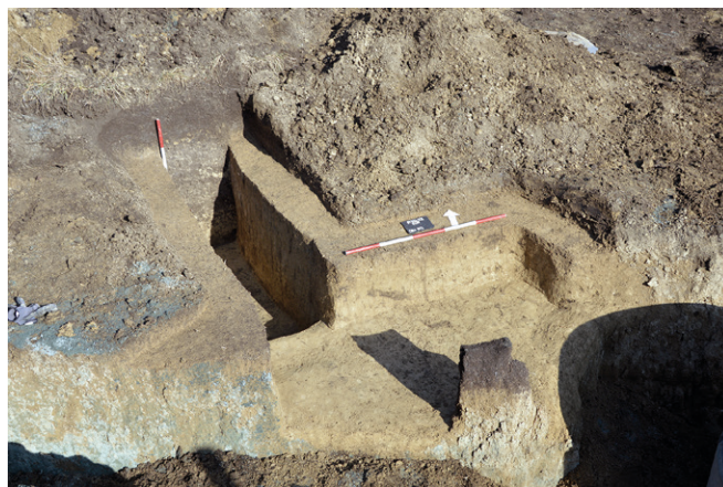
Obr. 79. Syrovice. Okop z druhé světové války po vybrání.