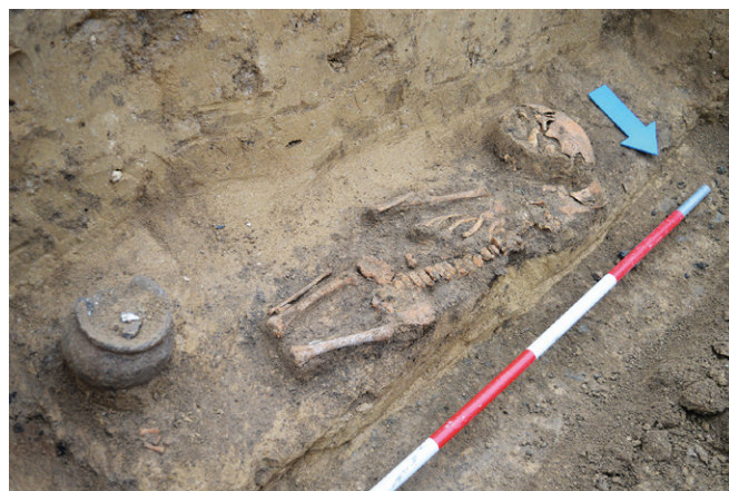
Obr. 85. Tvarožná (okr. Brno-venkov). Kostrový hrob H 813.

Hroby lze spojit s kostrovým pohřebištěm s 9 hroby, které byly ve stejné trati prozkoumány roku 1935 a při výstavbě staršího vodovodu pracovníky Archeologického ústavu ČSAV v Brně roku 1979 (Čižmář et al. 1981).